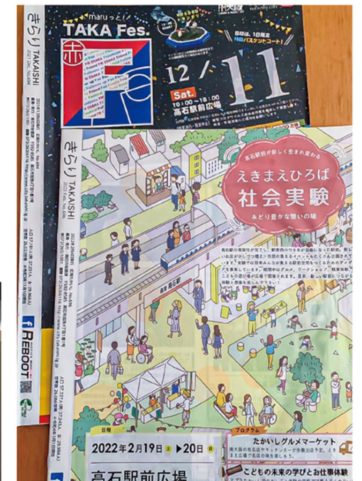
高石駅前広場構想(5億円)実験